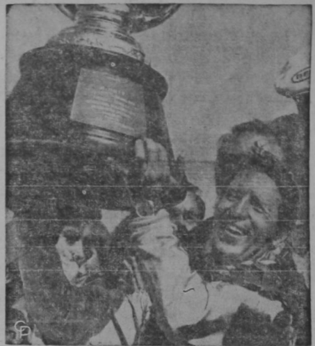
GRAN VICTORIA PARA MARIO. —En la pista de Ontario, California MARIO ANDRETTI, de Medía, Pa, agrega una victoria más a su famosa colección: Ganó el "Gran Pri de Quetzal" y con eso un gran trofeo, conduciendo su "Ferrari" italiano de 12 cilindros, Fórmula 1.